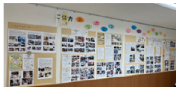
活動写真展(こどもの多摩里食堂)

6月2日(金)からは「NPO法人えるぶ」による作品展示【アイム展】が開催されます。