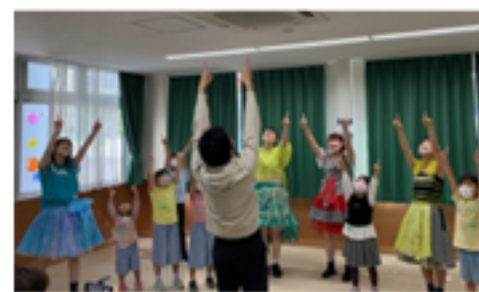
ダンスワークショップ(プラスニューカンパニー)

登録している市民活動団体の活動報告の写真展示や絵画などの作品を2週間展示することができます。