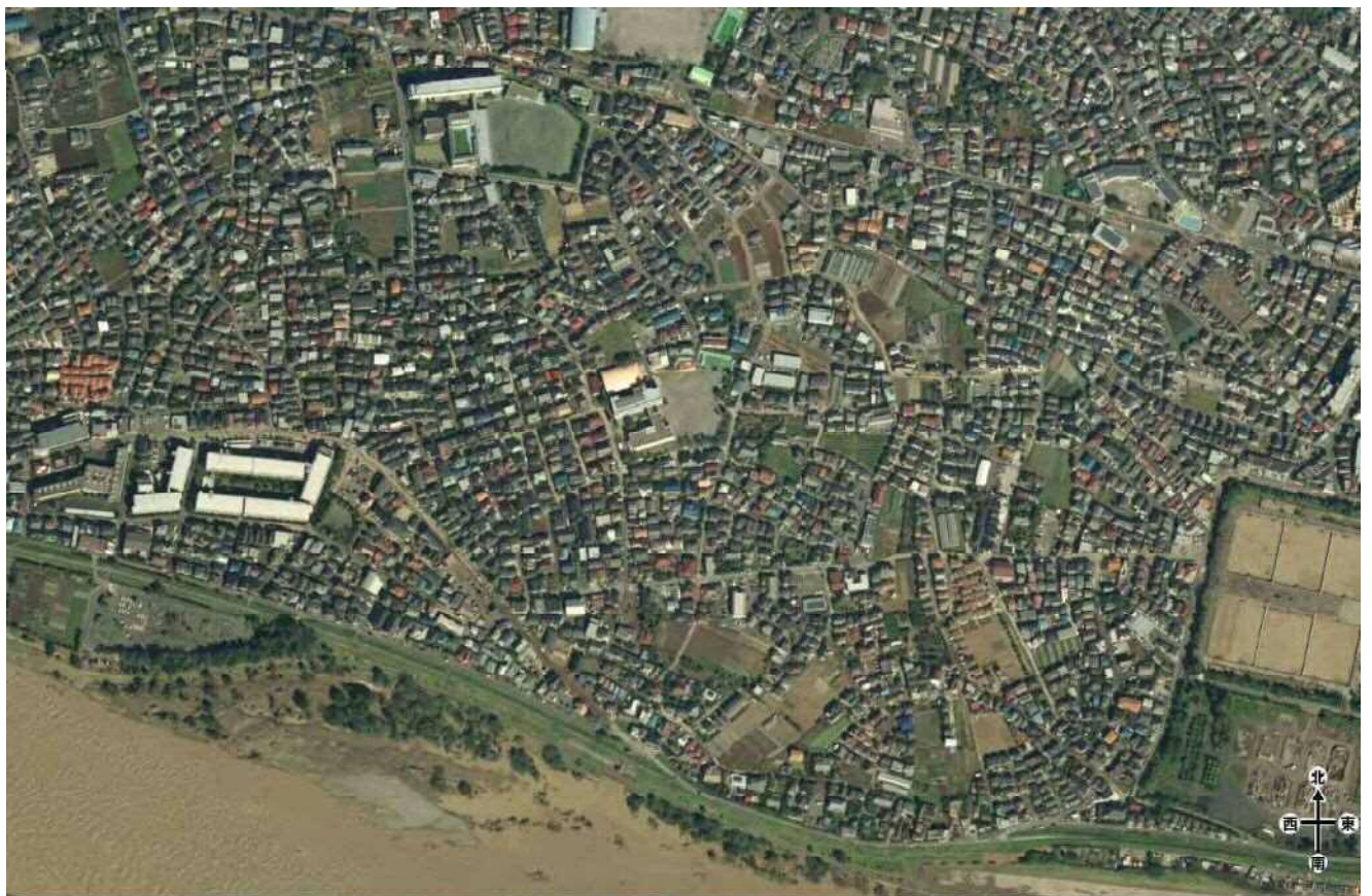
写真 4-1-1 国土地理院空中写真（正射画像）10/13 撮影 猪方排水樋管周辺