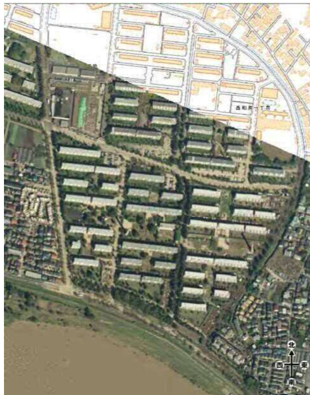
写真 4-1-2 国土地理院空中写真（正射画像）10/13 撮影 六郷排水樋管周辺