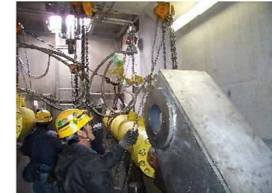
ゲート開閉装置交換 (監査廊内部)