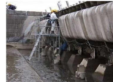
ゲート水密ゴム交換