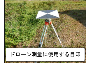
ドローン測量に使用する目印

ドローン測量に必要な目印を地上に設置します。 河川敷等ご利用の際は触れないよう、お願い申し上げます。