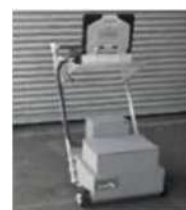
路面下空洞調査 （ハンディ型地中レーダー）

・ 応急復旧箇所周辺（谷戸橋～小足立橋）をハンディ型の地中レーダー探査機を用いて路面下の空洞調査を行う予定です。