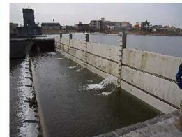
角落しゲート設置