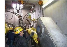
ゲート開閉装置交換 (監査廊内部)