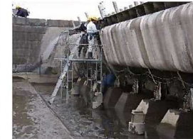
ゲート水密ゴム交換