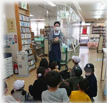
【小学校2年生の図書館施設見学の様子】