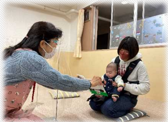
【3・4か月児を対象としたブックスタート事業の様子】