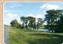
↑新東京百景の一つ「五本松」