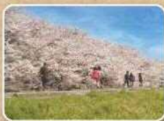
↑多摩川河川敷の桜並木

市内の街路灯はすべて省エネ・長持ちのLEDです。安心安全のため、暗い夜道を照らして市民の皆さんを守る役目を果たしています。