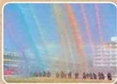
↑狛江市消防団出初式 一斉放水

市と地域団体が協働で防犯カメラを設置しています。犯罪の抑止、事件の早期解決が期待できます。