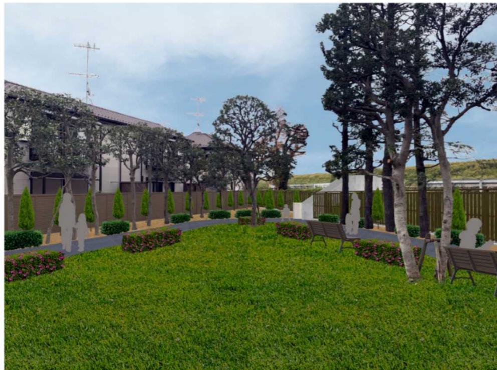
整備イメージ(中央芝生広場から南東方向のようす)