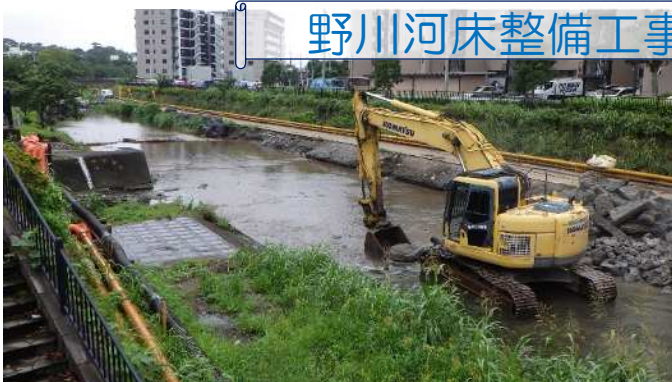
写真① 施工状況(小足立橋から下流)