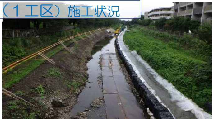
写真② 施工状況(谷戸橋から下流)