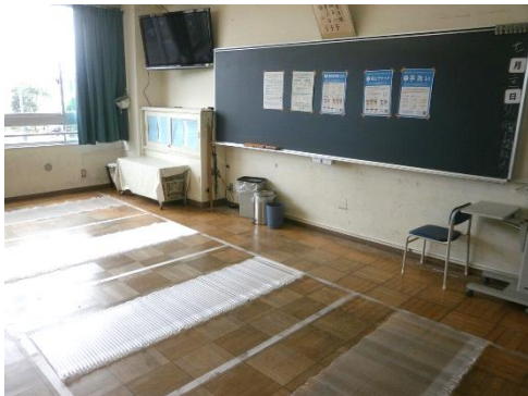
一般避難スペース