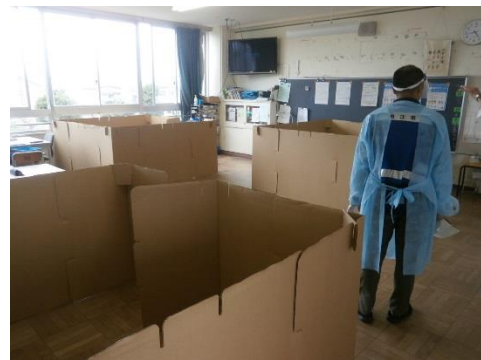
自宅療養者等スペース