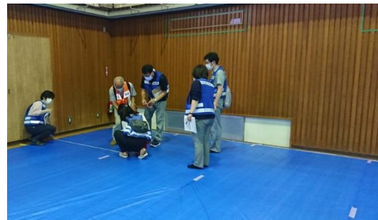
体育館避難スペース確認