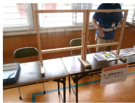
避難者カード等受付