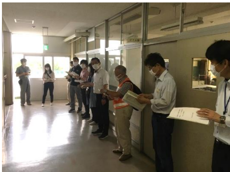
校舎内避難スペース確認