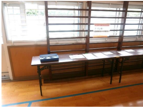
問診票・避難者カード記載