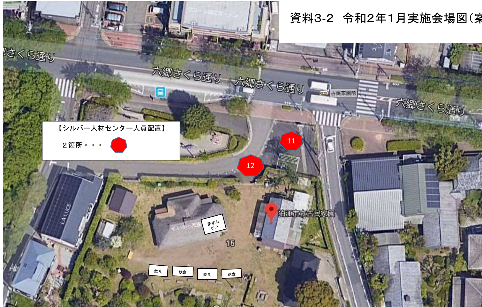
資料3-2 令和2年1月実施会場図(案)11/26時点