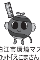
狛江市環境マスコット「えこまん」

取組みではないこと ※推薦は、自薦・他薦を問いません。他薦の場合は取組みを行っている方の了承を得てください。 ※詳細は、パンフレット(環境政策課窓口で配布)またはホームページをご覧ください。 ※表彰制度の他、環境保全に関する取組みを行っているまたはこれから行う個人、事業者、団体を「狛江市エコパートナー」として認定しています。 申問 11月30日(金)までに、狛江市環境表彰制度推薦書(市ホームページからダウンロード可)、その他参考資料等を環境政策課環境係へ。