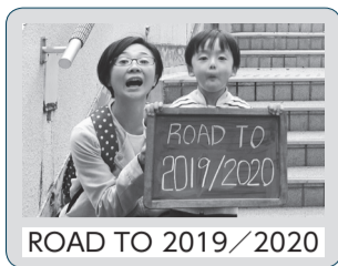
ROAD TO 2019/2020