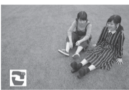
狛江市民(みゆう&もあ)

■駅前ライブ 狛江駅前の開放的な雰囲気の中ですてきな音楽をお届けします。 日 10月7日(日)午後1時～1時45分(予定) ※雨天の場合は、中止または時間帯を変更する場合あり。 所 狛江駅北口交通広場 出演 狛江市民(みゆう&もあ)(ヴォーカル&キーボード女性ユニット)、サウンドリバー(ジャズ、ポップス) 問 一般財団法人狛江市文化振興事業団 ☎(3430) 4106(火曜日休館) ■かわせみコンサート ▼第214回「懐かしの昭和歌謡」 日 10月21日(日)午後2時～4時(1時30分開場) 所 谷戸橋地区センター 出演 狛江ともしび音楽隊 問 地域活性課コミュニティ文化係