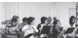
狛江ともしび音楽隊