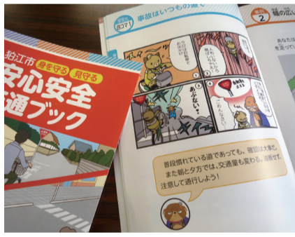
イラストを使って分かりやすくなっています

内 平成29年台風第21号の影響で、粕江水辺の楽校がごみの山になってしまいました。昨年からは、市・粕江水辺の楽校・市民が一体となって清掃活動を行っています。