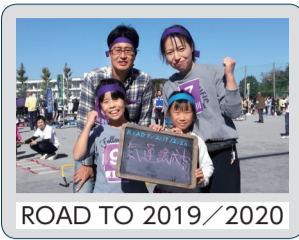
ROAD TO 2019/2020