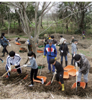
みんなで力を合わせましょう

内 平成29年台風第21号の影響で、粕江水辺の楽校がごみの山になってしまいました。昨年からは、市・粕江水辺の楽校・市民が一体となって清掃活動を行っています。