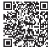
クラウドファンディングサイト「CAMPFIRE」