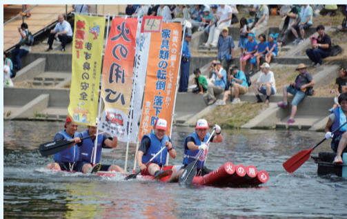
今年の夏も多摩川で盛り上がりましょう

申 5月31日(木) (定員に達し次第受付終了) までに、地域活性化課地域振興係へ。