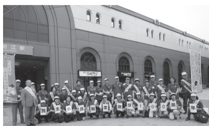
狛江駅前PR活動を行います