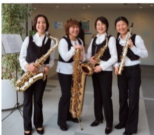
狛江市民吹奏楽団によるアンサンブル