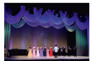
アンサンブル・オールウェイズ