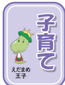
こまえ子育てねっと 検索

◎和泉児童館 ☎(3480)1441 ■栄養相談 ☑8月19日(月)午前10時～正午 ☑乳幼児親子 ☑栄養士の先生が食の悩みの相談に乘ります。 ■すくすく測定 ☑8月19日(月)午前10時～正午・28日(水)午後1時30分～2時30分 ☑乳幼児親子 ☑子育て相談員が子どもの身長、体重を測定 ◎岩戸児童センター ☎(3489)5414 ■すくすく測定 ☑8月22日(木)午前10時30分～11時30分 ☑乳幼児親子 ☑身長・体重の測定 ■パパデー「バランス遊び」 ☑8月24日(土)午前10時～正午 ☑乳幼児親子 ☑パパも一緒に体育館でダイナミックな遊びを楽しみましょう。 ☑おはなし会 ☑8月26日(月)30分 ☑12組程度 ☑保育サービスクーディネーターを交えて懇談 ☑8月19日(月)から ◎こまつ児童館 ☎(3480)5701 ■ちやれんじタイム ☑8月20日(火)～24日(土)午前10時～午後1時 ☑乳幼児親子 ☑9月～11月のカレンダー作り ■こまつこJUMP JAM ☑8月31日(土)午後4時～4時30分 ☑小学校高学年以上 ☑スポーツと自由な遊びを合体させた運動遊びプログラム ◎子ども家庭支援センター ☎(5438)6605 ■ねんね赤ちゃんのお部屋 ☑8月15日(木)・29日(木)午前10時～正午 ☑ねんね時期の子どもと保護者の交流 ■キテ・キテおはなし会 ☑8月26日(月)午前11時～11時30分 ☑絵本の読み聞かせやリズム遊び ■しゃべり場たんぽぽ ☑9月3日(火)午前10時30分～11時30分 ☑12組程度 ☑保育サービスクーディネーターを交えて懇談 ☑8月19日(月)から