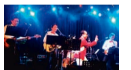
成城クレイジー ベンチャーズ