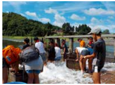
やな場で川魚のつかみ取り

日 8月10日(土)~11日(日) (1泊2日) 対 市内在住の小学生とその保護者 定 20人 (多数抽選) 内 1日目 木沢焼きの絵付け体験、ソーセージ作り体験、星空観察、ホテルサンローラ宿泊(温泉付き) 2日目 野菜の収穫体験、川魚のつかみ取りイベント(参加費1人1,000円・現地で支払い) ※天候等によって、内容を変更する場合があります。 料 大人 1万6,000円 子ども 1万1,000円 ※宿泊費・一部食費・プログラム参加費含む。 申 6月30日(日)までに、専用フォームで地域活性課コミュニティ文化係へ。