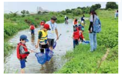
どんな生きものが見つかるかな?

日 7月13日(土)午前9時30分~11時15分(雨天時は20日(土)に延期) 受 午前9時15分 所 狛江水辺の楽校入口 対 市内在住の小学生以上の方(小学校低学年は保護者同伴) 定 30人 内 水生生物、昆虫の採集調査、観察 持 川に入れる服装・靴(長袖、長ズボン・滑りにくい靴等。サンダル・長靴不可)、帽子、タオル、飲み物、必要な方のみ替えの靴、お持ちの方は網等 申 6月17日(月)から、環境政策課水と緑の係へ。