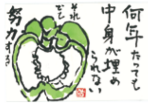
「狛江-絵手紙サポーター」からの作品