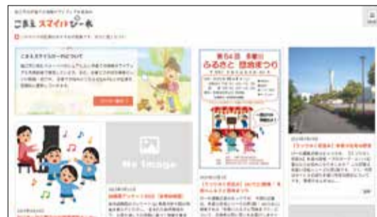
新しくなったサイト▼

「こまえスマイルぴーれ」は、子育てを応援しようという市民による市の子育てに関する制度やオススメスポットなど、市民目線による情報発信サイトです。