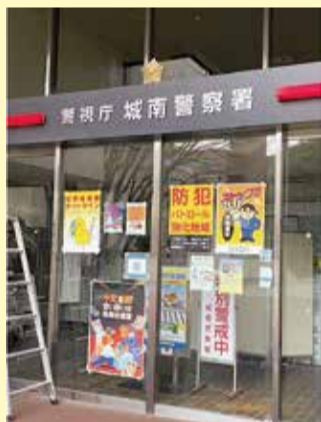
ドラマ「Dr.チョコレート」では市役所が警察署に