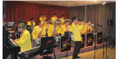
IZUMI SWING ORCHESTRA

■第294回かわせみコンサート「NEW YEAR JAZZ CONCERT」 日 2月4日(日)午後2時～3時30分(1時30分開場) 所 谷戸橋地区センター 出演 IZUMI SWING ORCHESTRA 問 地域活性課コミュニティ文化係