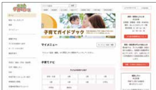
新しくなったサイト▼

「こまえ子育てねっと」は、子育てに関する最新の行政情報、地域密着のイベント情報、メール相談など便利なコンテンツが満載な子育て情報専用サイトです。