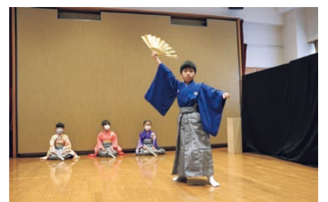
きらびやかな衣装で能楽を発表