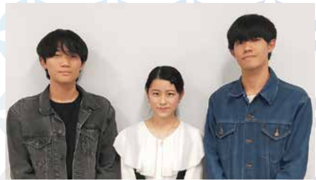
狛江市二十歳を祝う会企画実行委員会の皆さん