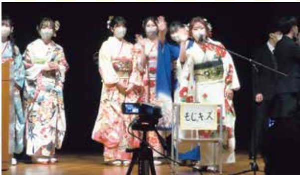
思い出に残る1日にしましょう