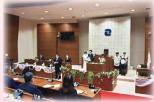
議場での挙式の様子