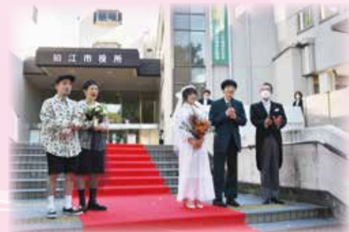
お披露目会の様子