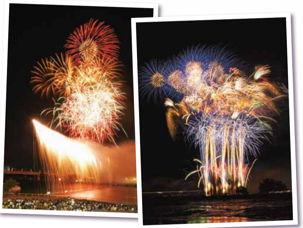
迫力満点の花火が打ち上がります