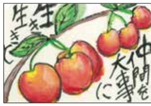
「絵手紙発祥の地—狛江」 公募展受賞作品