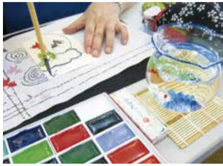
誰でも楽しく絵手紙体験

4月20日(木)午前10時～正午 受午前11時まで(初めてのの方は10時までにお越しください) 所エコルマホール6階展示・多目的室 内絵手紙をかいたりアドバイスを受けられます。 師「絵手紙発祥の地」狛江」実行委員 問「絵手紙発祥の地」狛江」実行委員会事務局(一財) 狛江市文化振興事業団 ☎(343) 343