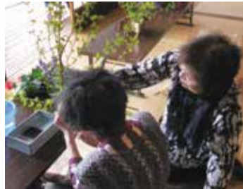
生け花で春を感じてみませんか