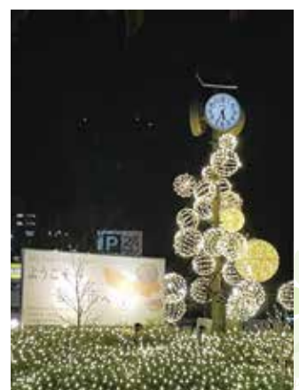
イルミネーション点灯事業