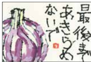
「絵手紙発祥の地一泊江」 公募展受賞作品