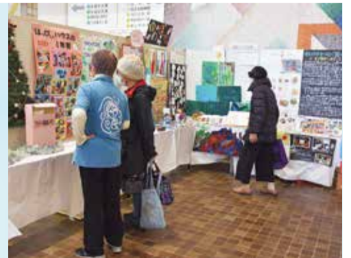
誰もがお互いに支え合う社会を目指しましょう