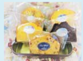
ワークイン・メイ