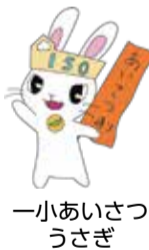
一小さいさうさぎ

メイン会場である狛江第一小学校の開校150周年を記念し、校舎内や体育館でさまざまな催しを実施します。