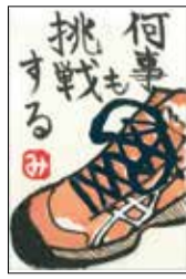
「絵手紙発祥の地—狛江」 公募展受賞作品