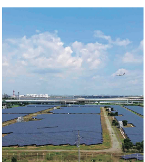
メガソーラーの見学もあります