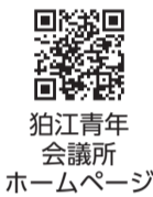
拍江青年 会議所 ホームページ