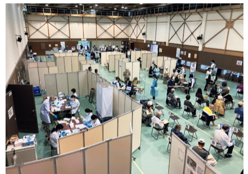
集団接種会場の様子(上和泉地域センター)

ワクチン接種会場（上和泉地域センター）への無料シャトルバスの運行は、7月31日(土)で終了します。