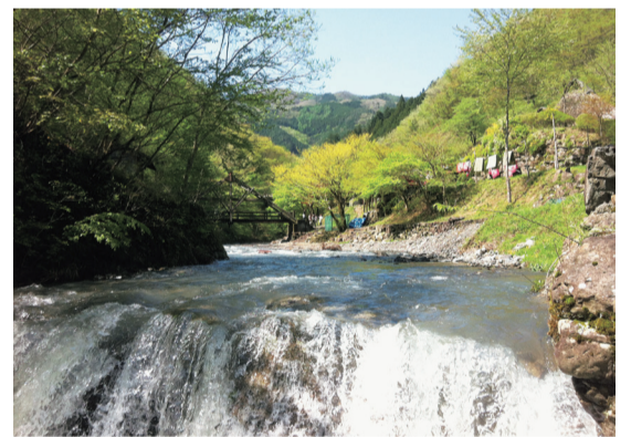
小菅村の豊かな自然を体感できます

■申問 7月25日(日)(必着)までに、電子申請(1回につき2人まで)で子ども政策課企画支援係へ。