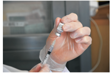
ファイザー社製ワクチン

開始時期等詳細は、準備が整い次第、市ホームページ・LINE・SNSでお知らせします。