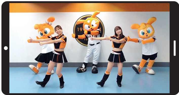
ジャビット、ヴィーナスと一緒に運動しよう