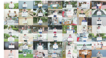
市民からひとことメッセージ