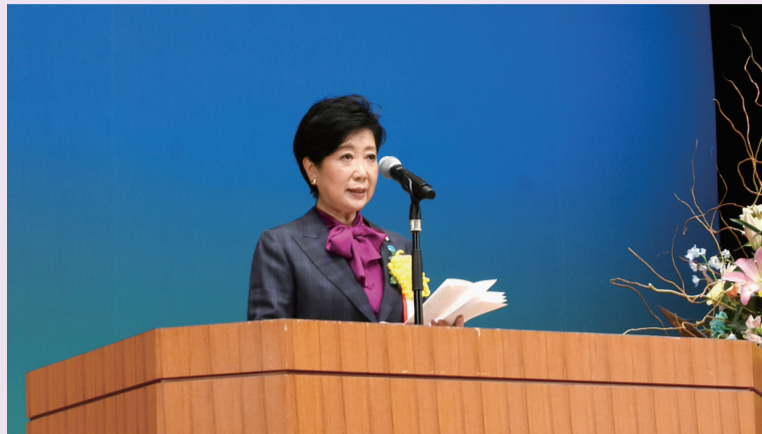
来賓としてご臨席いただいた小池百合子都知事