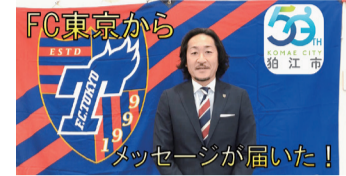
FC東京からお祝いコメント