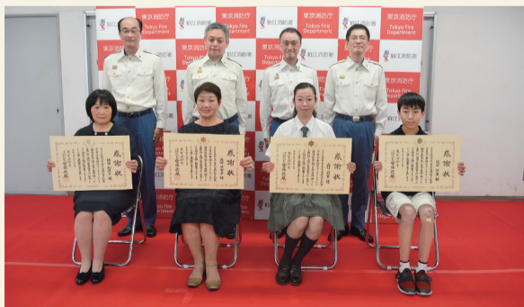
消防総監感謝状を贈呈された皆さん