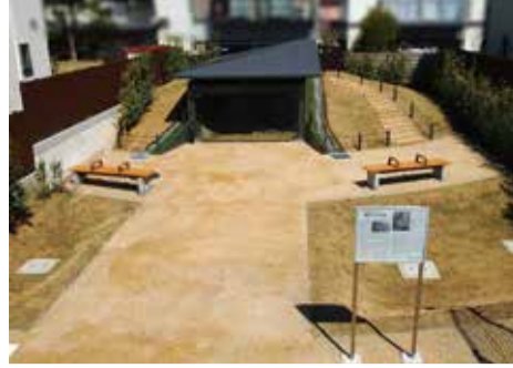
猪方小川塚古墳公園

持つ古墳です。平成23年に発見された後、保存と公開の方法等について検討を行い、平成30年度から石室の保存処理や古墳の復元、整備工事を進めてきました。 公園内には、古墳の大きさや古墳を取り巻く周溝の様子を復元し、横穴式石室は保存処理を行った上で覆屋を建て、保存しています。覆屋のガラス越しに、実物の横穴式石室を見学することができま