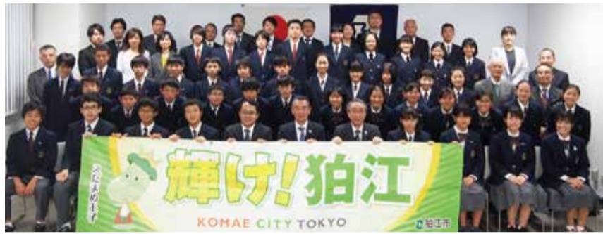
応援よろしく申し上げます

2月2日(日) 時 開会式 午前9時30分から 女子の部 午前10時から 男子の部 午後1時から 閉会式 午後4時から 所 アミノバイタルフィールド・都立武蔵野の森公園特設周回コース 競技 女子の部(30km) 第1区(第10区(1.5km)、第11区(第16区(2.5km) 男子の部(42.195km) 第1区(第9区(2km)、第10区(第17区(3km) 区指導室