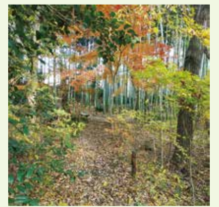
市民が開発から守った貴重な緑地です