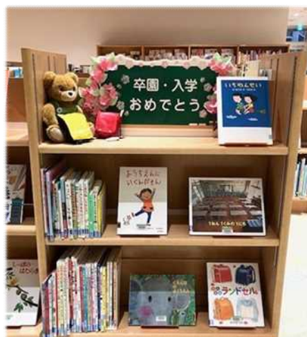
3月)入園・入学おめでとう