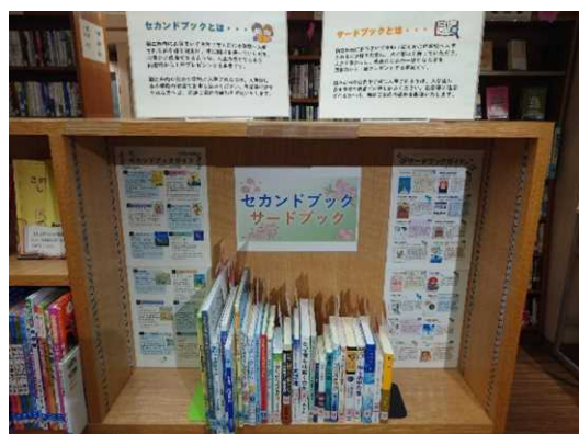
【セカンドブック・サードブック】 見本図書の展示