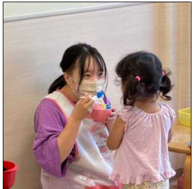
子ども家庭部 児童育成課 主事 K.Y 職種：保育士

狛江市は本当に自然が豊かで、保育園でも色々な公園や、近くの多摩川へ散歩に行き、のびのびと過ごしたりしています。子ども達と散歩に行っても、すれ違う地域の方々が、優しく『おはよう』と声をかけてくださったり、温かい人達がとても多いように感じます。