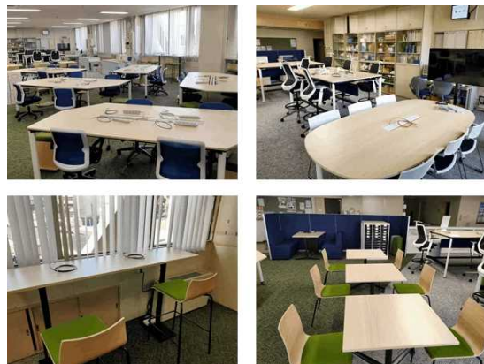
フリーアドレス化された4階執務室