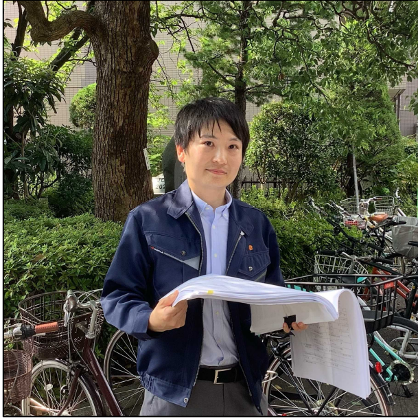
都市建設部 まちづくり推進課 主任 Y.S 職種：一般技術