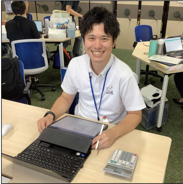
企画財政部 財政課 係長 T.Y 職種：一般事務