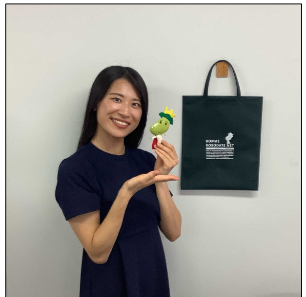
子ども家庭部 子ども若者政策課 主事 K.N 職種：一般事務

また、都心から近く、便利さを感じる一方で、多摩川などの自然が豊かであり、私も時々川沿いをランニングしますが、心の落ち着きを感じられるところも粕江市の魅力の一つと考えています。