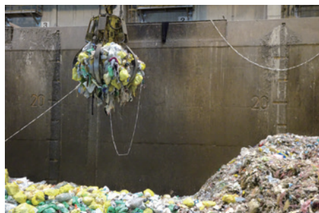
クリーンセンター多摩川(多摩川衛生組合) 収集したごみをためるピット