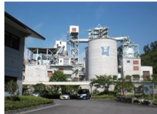
二ツ塚処分場エコセメント化施設 (東京たま広域資源循環組合)