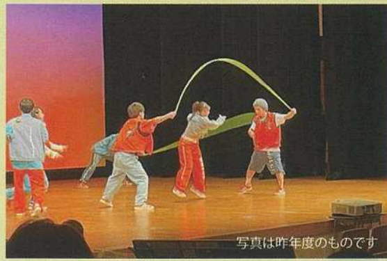
写真は昨年度のものです