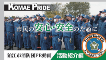
「市民の安心・安全のために(活動紹介編)」【3分版】