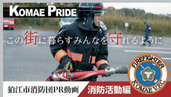
「この街に暮らすみんなを守るように(消防活動編)」【20秒版】