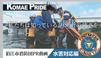
「私たちは知っている水害の怖さを(水害対応編)」【20秒版】