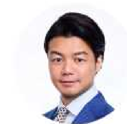
創業者 代表取締役社長 弁護士