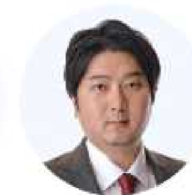
取締役 クラウドサイン事業責任者 弁護士