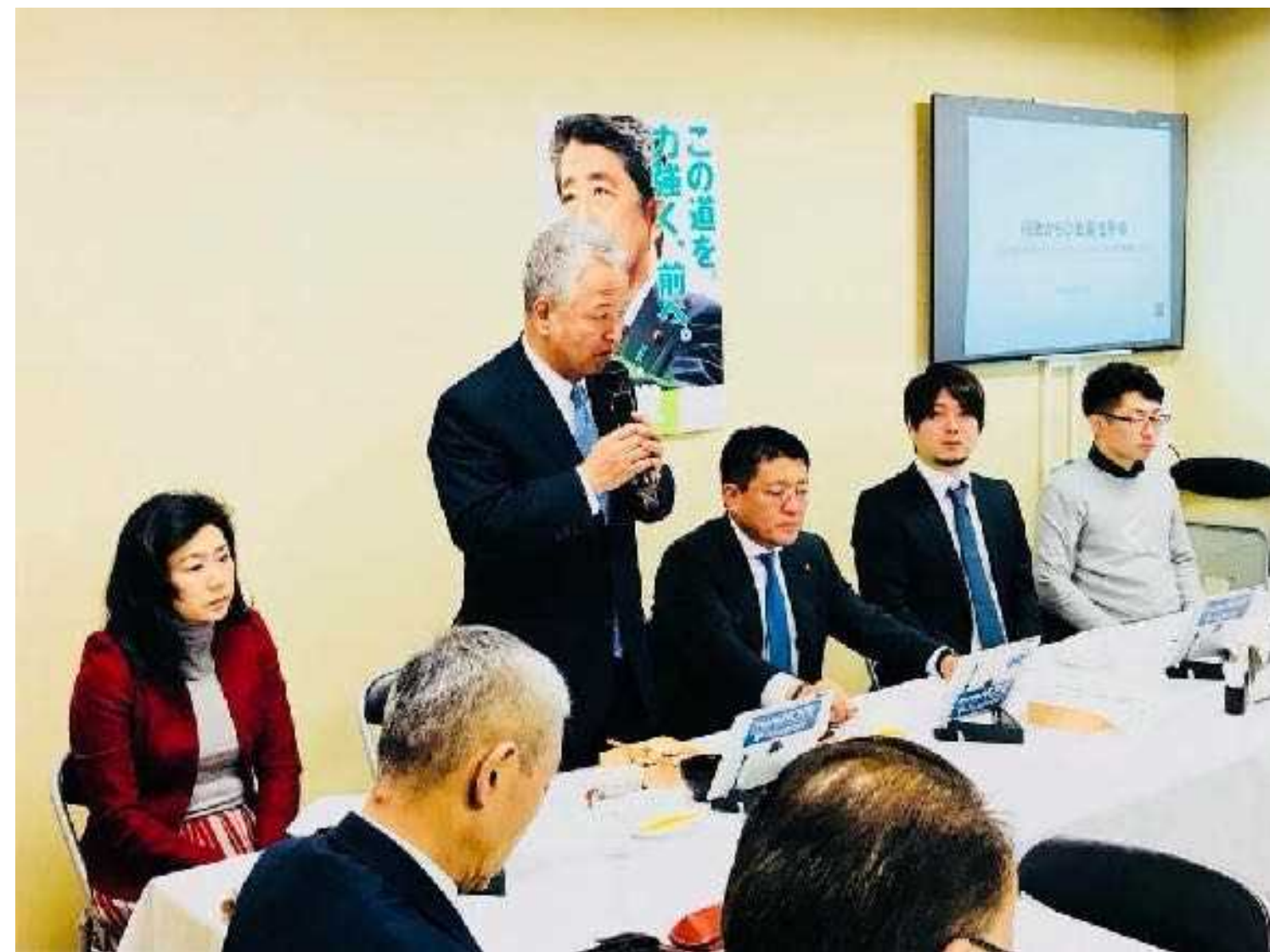
政府へのIT化戦略のご提言

日本の電子契約市場の立ち上がりを支え、政府へのIT化戦略のご提言を始めとし、電子契約の普及とともに、事業を成長させてきました。