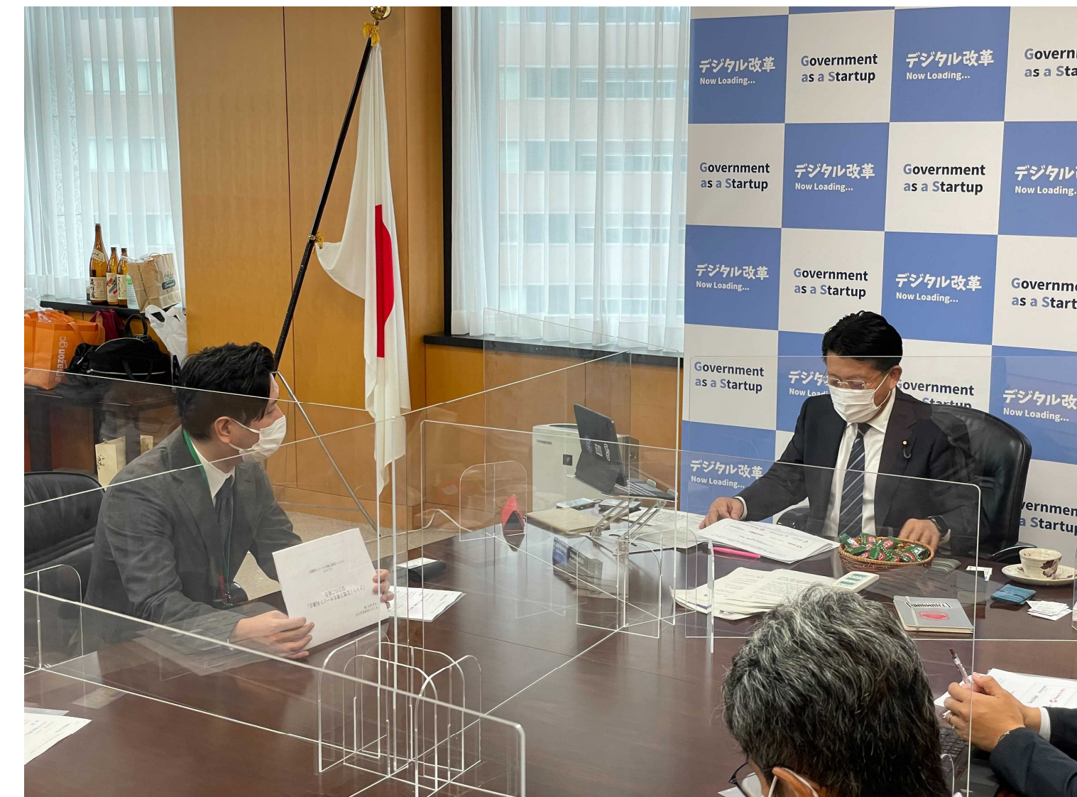
クラウド型電子署名サービス協議会の設立