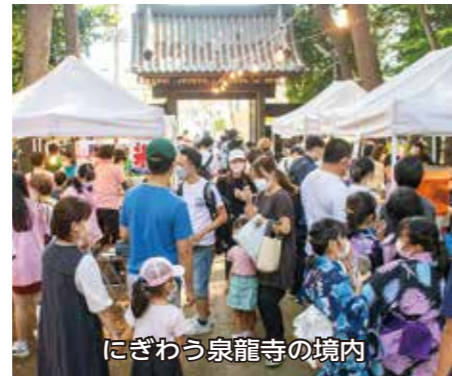
にぎわう泉龍寺の境内

泉龍寺では特設舞台上で音楽やキッズダンスなどが披露された。境内ではゲームや菓子などの出店