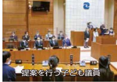
提案を行う子ども議員

今回は、多摩川をテーマ に、子ども議員が3グループ に分かれ事前にワークショップ を開いて現地調査などを行 い、その結果を元に考えたア イデアを提案する方式が今年 から新たに採用された。子 ども議員からは「多摩川×防 災プロジェクト」狛江の文化 を伝える祭りを新しく増や したい「えだめカフェで多 摩川を盛り上げよう」という