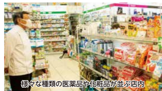
様々な種類の医薬品や化粧品が並ぶ店内