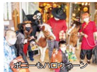
ポニーもハロウィーン

る。この日は利用者 の子とボランティアな ど約20人が魔法使 いの衣装で仮装、「 ナナの家」で飼って いる2匹のポニーも 加わって都営狛江 アパートや公園通 り沿いにある介護 付有料老人ホーム 「SOMPOケアラ ヴィーレ狛江」な どを回った。子ど もたちは菓子など