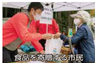
食品を寄贈する市民

以前から取り組んで いる商工会青年部の全 国統一事業「絆感謝運 動」の一環で、協力を 呼びかけるチラシを配 ったほか、15日回から 20日回まで商工会館 と部員が経営する6店 舗でもフードドライブ を実施した。集まった 91.1kgの食料は22 日回NPO法人フード バンク狛江に寄贈し た。