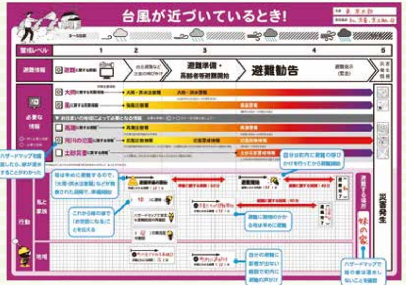
東京マイ・タイムラインの作成例