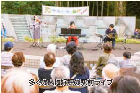
多くの人が好評の駅前ライブ

楽器・機材は持ち込み(基本PAは主催者で用意)。応募は代表者の氏名、住所、電話番号、メンバー構成、プロフィールを明記し、音源(CD-R等に2曲程度)を(一財)狛江市文化振興事業団 駅前ライブ 応募係(〒201-0013 東京都狛江市元和泉1-2-1)へ郵送または持参