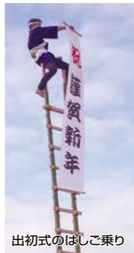
出初式のぼしご乗り

「こまえ初春まつり」が12日目に市内各所で開催される。昨年まで会場だった多摩川緑地公園グラウンドが台風19号による多摩川の増水で被害を受けたため、猪江市消防団出初式がエコルマホールへ変更されたほか、猪江市ボーイスカウト連絡協議会によるどんど焼は安全を考慮して中止となった。