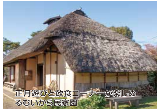
正月遊びと飲食コーナーが楽しめるむいから民家園

第50回猪江多摩川ロードレース大会は午前8時45分に開会式を行った後、9時40分から猪江高校西側をスタート地点に多摩川堤防上に設けられた1キロ、2キロ、3キロ、5キロ、10キロのコースでタイムを競う。レースには駒澤大学に加え、