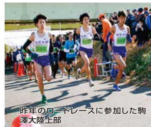
昨年のロードレースに参加した駒澤大陸上部