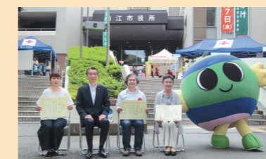
平成30年度表彰式の様子