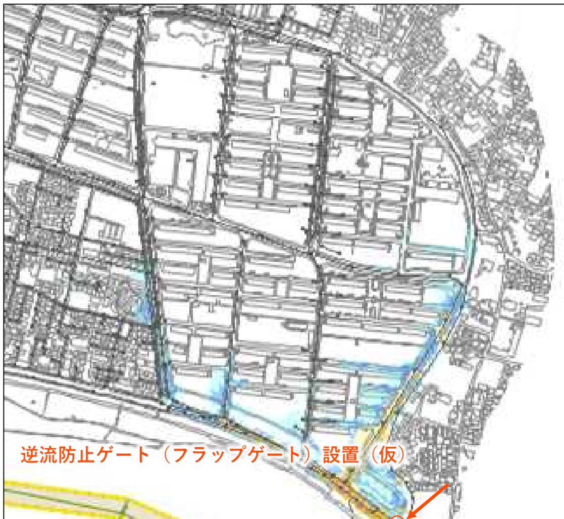
樋管操作+河道掘削+逆流防止ゲート (フラップゲート) 設置