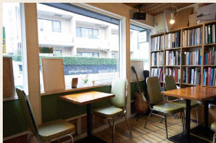
ライブラリーが併設されたカフェは、大きな窓が心地よい。イベント時には、賑わう人影が街並みの風景を豊かにしてくれる。