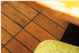
手先の器用なアーティスト仲間達とDIYで施工した意匠性の高い室内。リノベーション費用を通常の半分程度に抑えることができた。