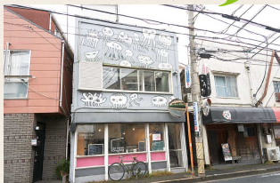
1階の店舗と2階の住居で別々に賃貸募集されていた建物を一体として利用することを家主に提案。アートの交流施設として活動を開始した。