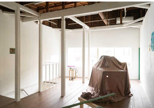
空き家の 使われ方