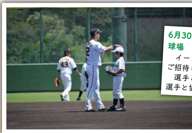
6月30日 粕江市民デーinジャイアンツ球場 イースタンリーグ戦に全粕江市民を無料で招待しました。 選手と運動会では、たくさんのお小生が選手と協力して競技を楽しみました！