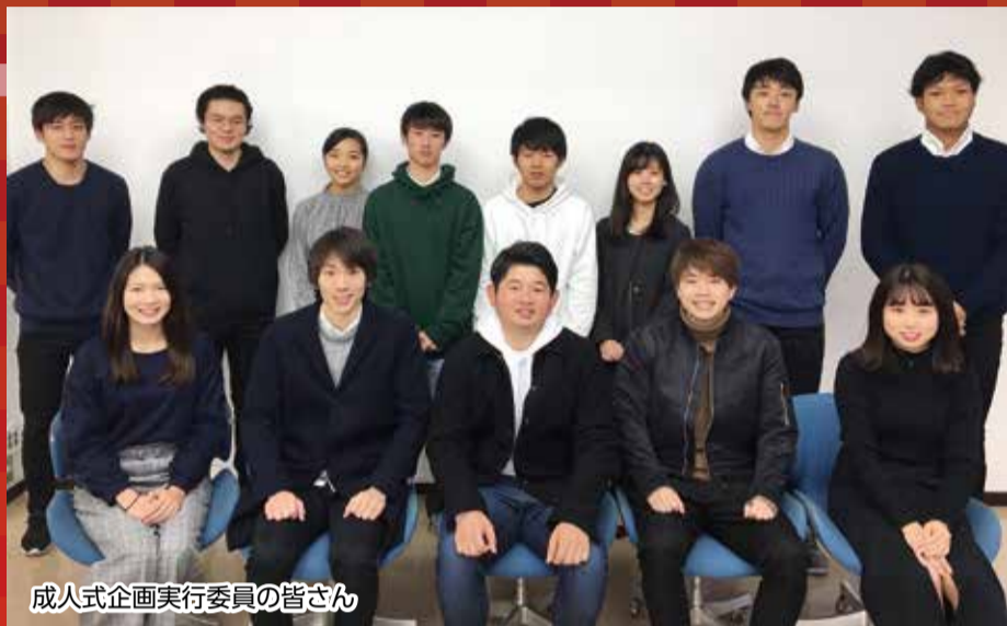
成人式企画実行委員の皆さん