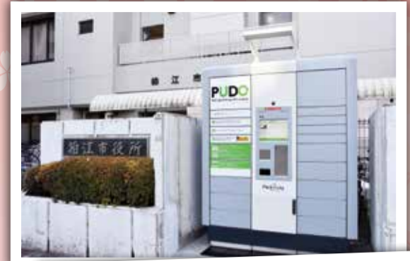
1月25日 市役所に宅配便ロッカー誕生 24時間利用できる宅配便ロッカーが市役所庁舎東側出入口横に設置されました。利用料は無料なので、ぜひご利用ください。