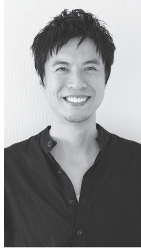
コウケンテツさん

平成31年1月20日(日)午後1時30分～3時30分(1時開場) 所中央公民館 定 先着130人(要予約) ※未就学児の託児あり(要予約・先着5人程度)。 ※手話通訳・要約筆記あり。 食を通じたコミュニケーションの大切さや、ごはんを中心とした家族の絆のつくり方など、「家庭」をテーマにした講演会 師コウケンテツさん(料理研究家) 申 12月17日(月)から平成31年1月11日(金)までに、氏名(ふりがな)・電話番号を、窓口・電話・ファクスまたは ☎kyodot@city.komae.lg.jp で政策室協働調整担当へ。