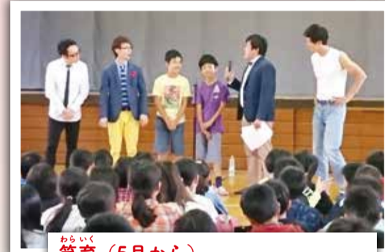
笑育(5月から) 松竹芸能株式会社の協力で漫才のネタ作りや発表を通して、想像力・発想力を育み、表現力の育成を図る「笑育」事業を実施。