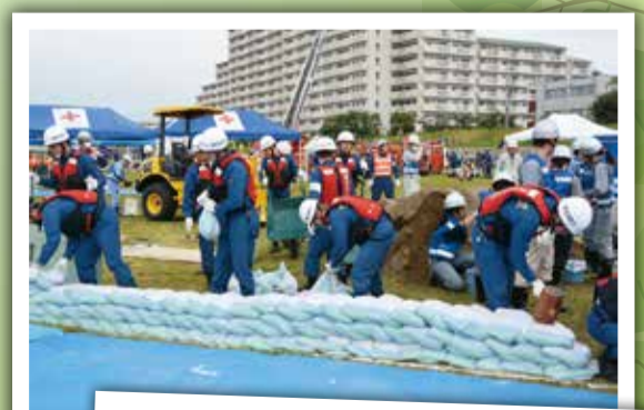
5月13日 総合水防訓練 出水期前に、万が一の水害に備えて多摩川河川敷での土のう作成や水防工法を実践。