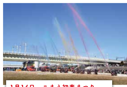
1月14日 こまえ初春まつり 今年度は、平成31年1月13日(日)に開催予定です。粕江の冬の風物詩でハートフルな1日を♡