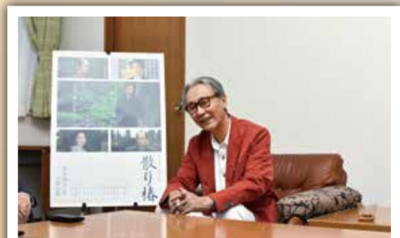
9月13日 木村大作さんが表敬訪問 市内在住の木村大作さんが監督・撮影を務めた映画「散り椿」が、第42回モントリオール世界映画祭で審査員特別賞を受賞。