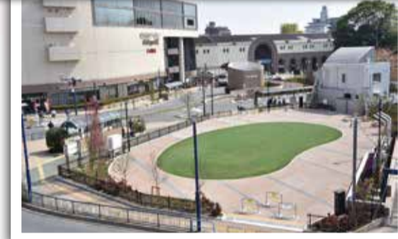
4月1日 メビウス∞えきま広場オープン 粕江駅北口の広場が新たにメビウス∞えきま広場としてオープン。にぎわいの創出の場として利用されています。

～いろいろなことがありました～ 平成30年も残すところあとわずかです。 皆さんにとってどのような1年だったでしょうか。 こまえの1年を振り返ってみました。