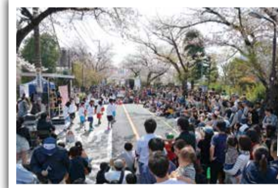
4月1日 こまえ桜まつり 来年度は、平成31年4月7日(日)に開催予定。ライトアップもお見逃しなく！