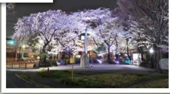
5月25日 みんなで輪をつくろう～粕江市平和祈念事業～ 昭和20年5月25日に粕江市で空襲がありました。平和を祈念して「みんなの輪」をつくりました。