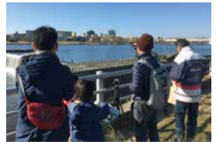
野鳥を探してみましょう