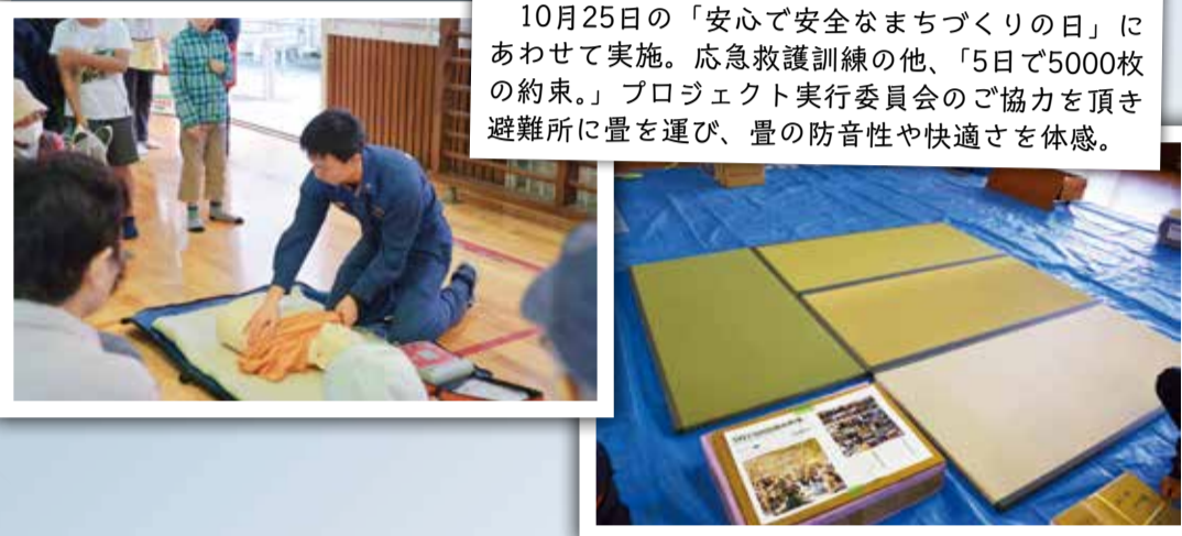
10月21日 粕江市総合防災訓練 10月25日の「安心で安全なまちづくりの日」にあわせて実施。応急救護訓練の他、「5日で5000枚の約束。」プロジェクト実行委員会のご協力を頂き避難所に畳を運び、畳の防音性や快適さを体感。