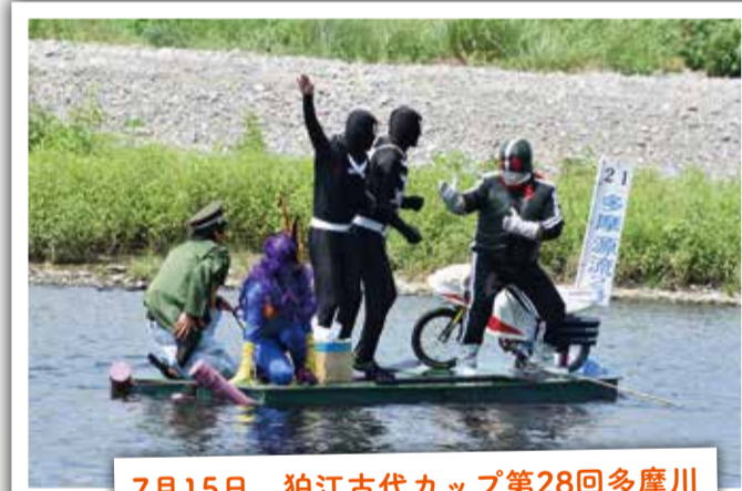
7月15日 粕江古代カップ第28回多摩川いかだレース 猛暑の中、ユニークないかだが登場！本当に暑かったー！