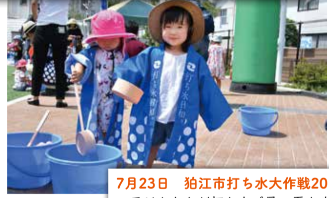
7月23日 粕江市打ち水大作戦2018 子どもたちが打ち水で暑い夏を吹き飛ばす！