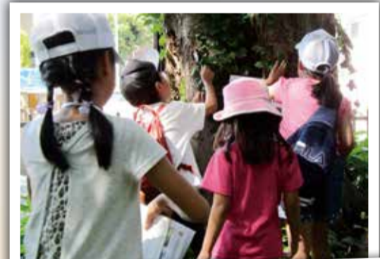
6～9月 こまえ生きもの探検隊 市内の生きものを調べた「こまえ生きもの探検隊」。市民の皆さんが主役です。