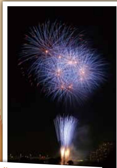
粕江・多摩川花火大会 今年の花火大会は台風により残念ながら中止…。しかし、来年8月7日(日)に開催できるよう準備を進めています！