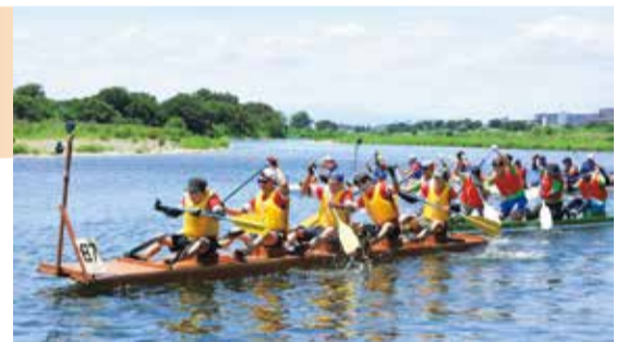
全国のいかだレース関係地域が狛江に大集結

多摩川流域からも多くの参加がある狛江市の一大イベント「狛江古代カップ多摩川いかだレース」。いかだレースや狛江の魅力を発信するとともに、全国各地でいかだレースを開催している地域と交流し友好を深めることを目的として、この夏、全国8つの地域が狛江に集まるサミットを開催します。