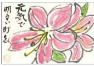
「狛江-絵手紙サポーター」からの作品