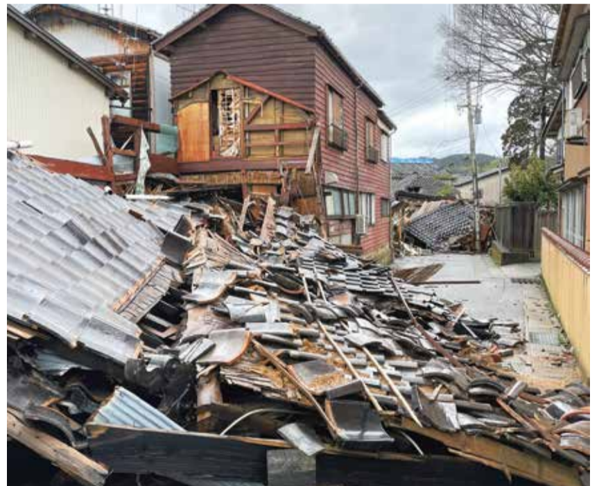
石川県輪島市の被害状況（令和6年2月）