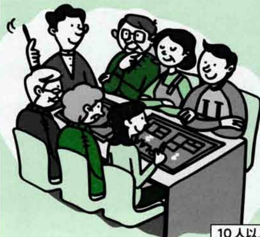
10人以上のグループが対象です。

これはどのごみで分けたいの? どうしてごみを減らさなければいけないの? どうやったらもっとごみが減らせるの? 狛江市のごみはどうやって処理されているの? などなど、ごみのごみで分からないことがありませんか? そんなときには、「まなび講座」をご利用ください。地域で、自治会で、お友だち同士で、気軽にお申し込みください。