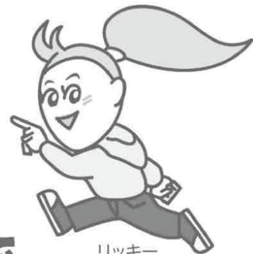
リッキー 選挙キャラクター